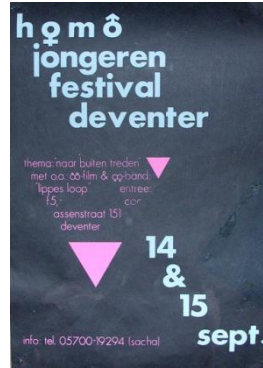
poster uit 1985

Het jaar 1985 was uitgeroepen tot 'Jaar van de Jongeren' en veel organisaties haalden ook alles uit de kast om leuke jongerenactiviteiten te gaan organiseren. Het COC Deventer had begin 1985 op dat gebied een probleem, want hoewel in het verleden regelmatig pogingen werden ondernomen om ook de jongeren erbij te betrekken (met steeds wisselend resultaat) was er in het nieuwe pand aan de Assenstraat geen echte jongerengroep meer actief. Een vijftal koppen werden bij elkaar gestoken en op 2 april 1985 kwam de Jongerengroep weer als herboren te voorschijn met een 'ontembare drang' naar meer jongerenactiviteiten in het COC. Naast opvang van andere jongeren in hun coming-out wilde deze groep ook lezingen, films en andere festiviteiten voor (homo-)jongeren gaan organiseren. Ga naar het hele artikel>>>