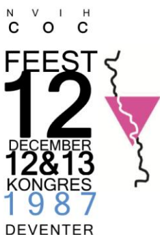
poster uit 1987

Vanwege het vijftien-jarig jubileum in 1987 van COC-IJsselstreek had Deventer zich als gaststad van dat COC-congres aangeboden. Tijdens dat jaarlijkse COC-congres werd het beleid en de koers van alle COC-afdelingen bepaald. Alle COC-verenigingen waren daarbij naar ledenaantal in vertegenwoordigd en dat betekende voor COC-IJsselstreek drie à vier congresleden met stemrecht (afhankelijk of de magische grens van 200 leden gehaald was). Ga naar het hele artikel>>>