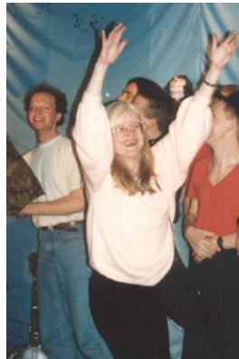
Feestelijk einde van de jubileumshow in 1992

Afdelingsblad Flipo had ter gelegenheid van het twintigjarig jubileum van het COC in Deventer in 1992 een gesprek met vier voorzitters, die tussen 1972 en 1992 aan het roer van het COC-schip hadden gestaan. Samen met andere vrijwilligers loodsten zij de jonge COC afdeling door woelige en rustiger tijden. Op zondagavond 2 februari 1992 kwamen ze bijeen om herinneringen op te halen: vier voorzitters die, bij elkaar opgeteld, twintig jaar COC-geschiedenis schreven.