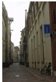
De buitenkant van het toenmalige COC-pand

Halverwege de jaren negentig had het COC-café na de tussentijdse verbouwingen in 1994 en 1996 een enorme opleving meegemaakt: druk bezochte café-avonden en in het kielzog veel actieve vrijwilligers en activiteiten. Maar hoewel de binnenkant van het pand flink was aangepakt bleef de buitenkant door gebrekkig onderhoud een zorgenkindje.