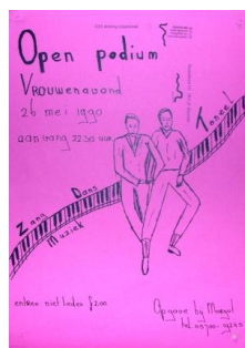
Poster uit 1990