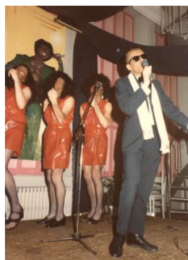
Optreden tijdens Sodom and Soul in 1985