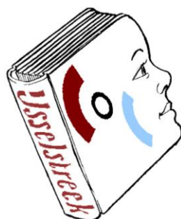
Logo van de nieuwe werkgroep COC-bibliotheek uit 1996