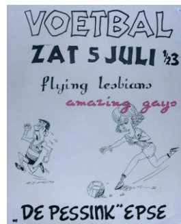
Voetbalwedstrijd tussen homo's en lesbo's in 1980

Het hele jaar blikken we terug op de vele ontwikkelingen en activiteiten die tussen 1972 en nu plaatsvonden. Iedere week te volgen op onze internetpagina.