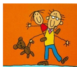
opa is lief

Eveline van de Putte is de schrijfster van Stormachtig Stil. In het boek vertellen oudere homoseksuele, biseksuele en transgender mannen en vrouwen openhartig over hun stormachtige (liefdes)leven en vaker nog over hun stilzwijgen en angst om nog altijd niet geaccepteerd te worden.